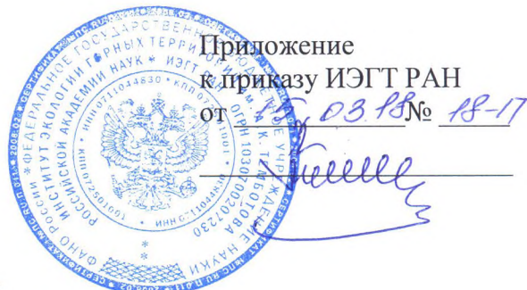
ГРАФИК проведения аттестации работников ИЭГТ РАН